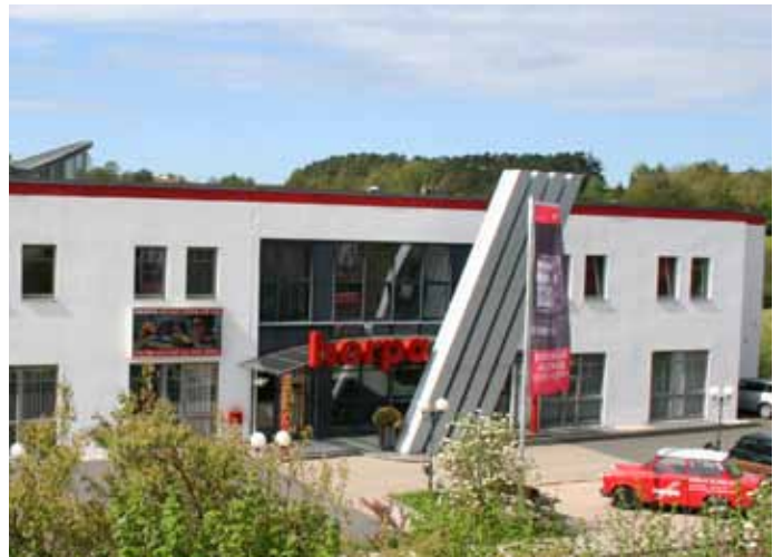
Herpa-Zentrale in Dietenhofen